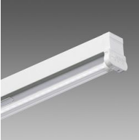
6402 Rapid system - monolampada LED