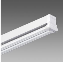
6502 Rapid system - bilampada LED