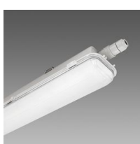
965 Hydro ICE-HT - high-low temperature