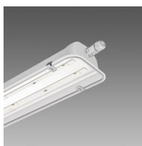
997 Forma LED - con diffusore in policarbonato