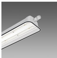
983 Forma LED - senza ganci per industria alimentare