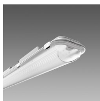
971 Ottima - High Performance