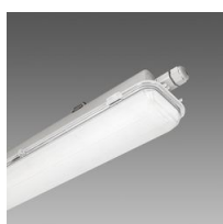
963 Hydro LED - High Performance