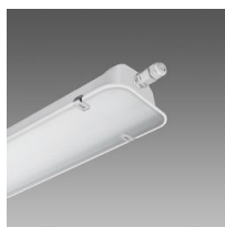
995 Forma LED - con vetro acidato