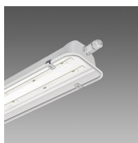
997 Forma LED - con diffusore in policarbonato