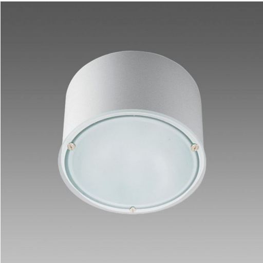
781 Compact - con SENSORE