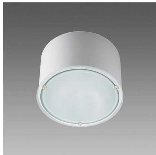
781 Compact - con SENSORE