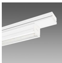
6606 Techno System - SINGOLO - UGR - CRI 80