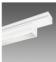
6613 Techno System - SINGOLO - bi-asimmetrico 25° - CRI 80