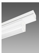
6616 Techno System - SINGOLO - diffusore semisferico diffondente - CRI 80