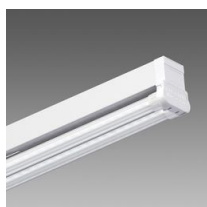
6502 Rapid system - bilampada LED