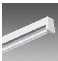
6402 Rapid system - monolampada LED