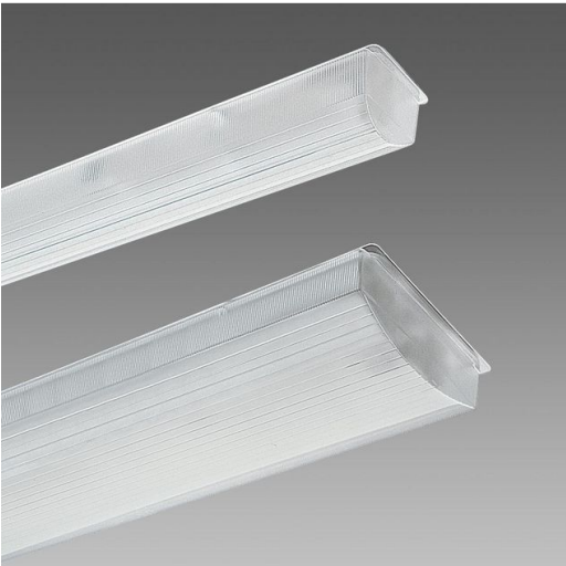
601 Disanlens - PREDISPOSTA PER TUBI LED