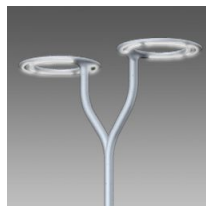
532 Braccio doppio