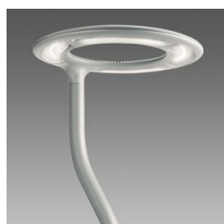
1441 Palo da interrare