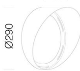
625 Convogliatore big