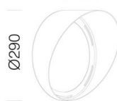
625 Convogliatore big