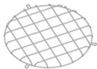
306 Gabbia di protezione - Cripto big