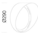
625 Convogliatore big