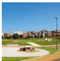
1493 Palo con base