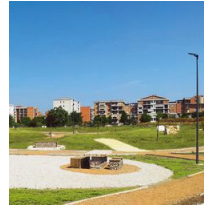
1493 Palo con base