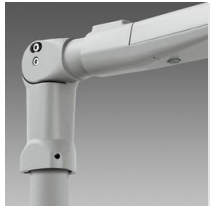
405 Attacco Snodato