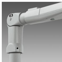
405 Attacco Snodato