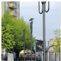
1491 Palo da interrare