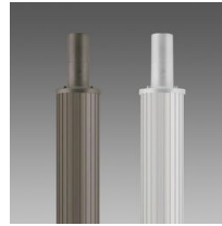
1509 Palo rigato \varnothing 120