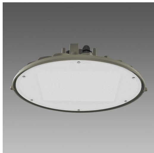
2881 Quark 3.7 - diffusore in policarbonato