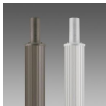
1508 Palo rigato \varnothing 120 con base