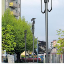
1491 Palo da interrare