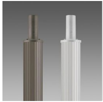
1508 Palo rigato ø 120 con base