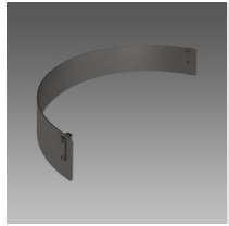
109 Schermo antiabbagliamento