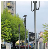
1491 Palo da interrare