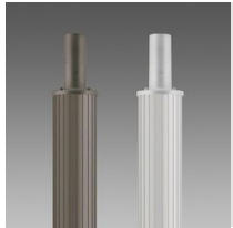
1508 Palo rigato \varnothing 120 con base