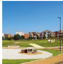
1493 Palo con base