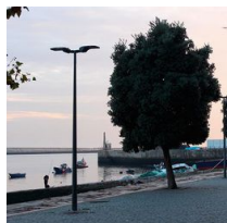
1481 palo conico in acciaio da interrare