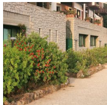
5 Palo in vetroresina