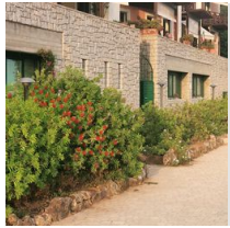
5 Palo in vetroresina