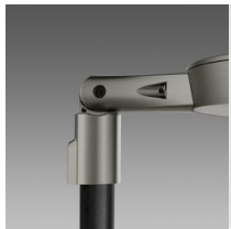
286 Braccio orientabile