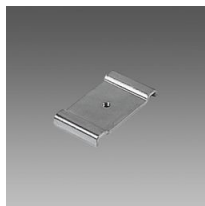
6036 Attacco universale