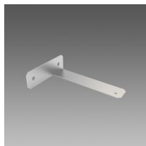
978 Staffa a parete