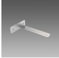
978 Staffa a parete