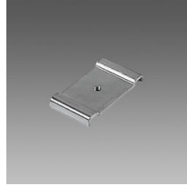
6036 Attacco universale