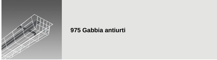
975 Gabbia antiurti