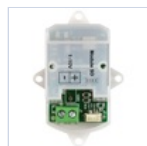
15034 MODULO 1-10V