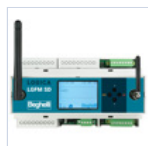
21102 CENTRALE DOMOTICA SD- LGFM