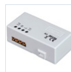
20104 TRASMETTITORE RADIO DOMOTICO