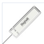
15022 MODULO RADIO DOMOTICO