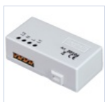
20104 TRASMETTITORE RADIO DOMOTICO