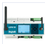
21102 CENTRALE DOMOTICA SD- LGFM