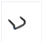
40930 STAFFA CURVA 250