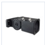
40932 TESTA PALO