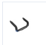
40930 STAFFA CURVA 250