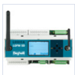
21102 CENTRALE DOMOTICA SD- LGFM