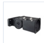
40932 TESTA PALO