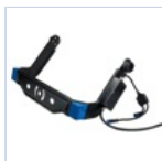
40931 STAFFA CURVA 300/400W