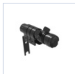
40933 PUNTATORE LASER