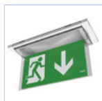
19043 SCHERMO BANDIERA BASSO F65