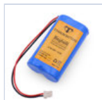
415419001 LTO 4.8V 1.2AH 18650 PACK