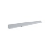
19045 STAFFA A PARETE X BANDIERA F65