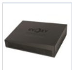
26723 CARTUCCIA EMERGENZA UVOXY