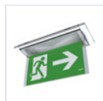
19042 SCHERMO BANDIERA DX/SX F65