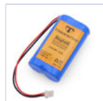
415419001 LTO 4.8V 1.2AH 18650 PACK