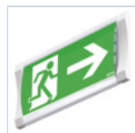
19044 ADES 3 SX DX BS F65