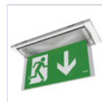
19043 SCHERMO BANDIERA BASSO F65