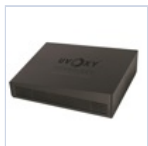
26723 CARTUCCIA EMERGENZA UVOXY