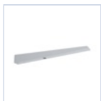
19045 STAFFA A PARETE X BANDIERA F65