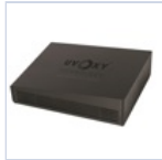
26723 CARTUCCIA EMERGENZA UVOXY