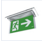
19042 SCHERMO BANDIERA DX/SX F65