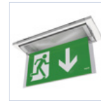
19043 SCHERMO BANDIERA BASSO F65