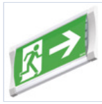
19044 ADES 3 SX DX BS F65