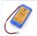
415419001 LTO 4.8V 1.2AH 18650 PACK