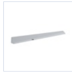
19045 STAFFA A PARETE X BANDIERA F65