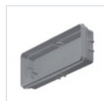
3733 INCASSO STILE 6W/11W 3106/IP