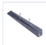
4265 STAFFA PARETE X BAND DES/COMP