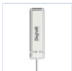
15048 MODULO RM PLUG