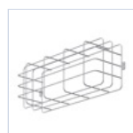
3912 GRIGLIA EM 440X215X99