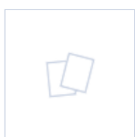
4269 SCHERMI DX/SX/BS DES/COMP LED