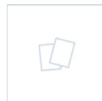
4264 STAFFA C.SOFFITTO STILE IN ALTA