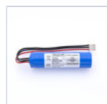
415436001 LI-FEPO4 3.2V 1.5AH 18650