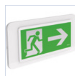
4278 ADES 3 SX DX BS DESIGNLED TECH