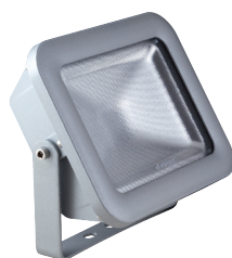
colore grigio RAL 9006 temp. colore 4000K