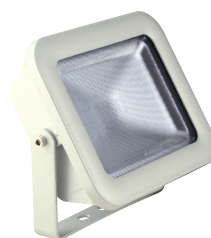
colore bianco RAL 9002 temp. colore 2700K