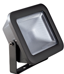
colore antracite RAL 7016 temp. colore 4000K