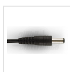
ø5,5 - 2,1mm