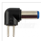
ø5,5 - 2,1mm