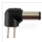
ø5,5 - 2,5mm