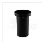
Cassaforma in plastica