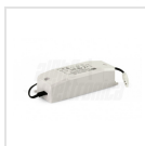
Alimentatore 1050mA corrente costante