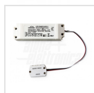
Alimentatore 1050mA corrente costante