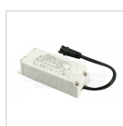
Alimentatore 230mA corrente costante