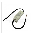
Alimentatore 650mA CC - Dim: 68x22x20mm