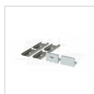
Terminali di chiusura e graffette di fissaggio