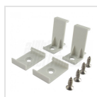
Ganci di fissaggio