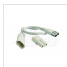
Set connettore e cavo per collegamento in serie